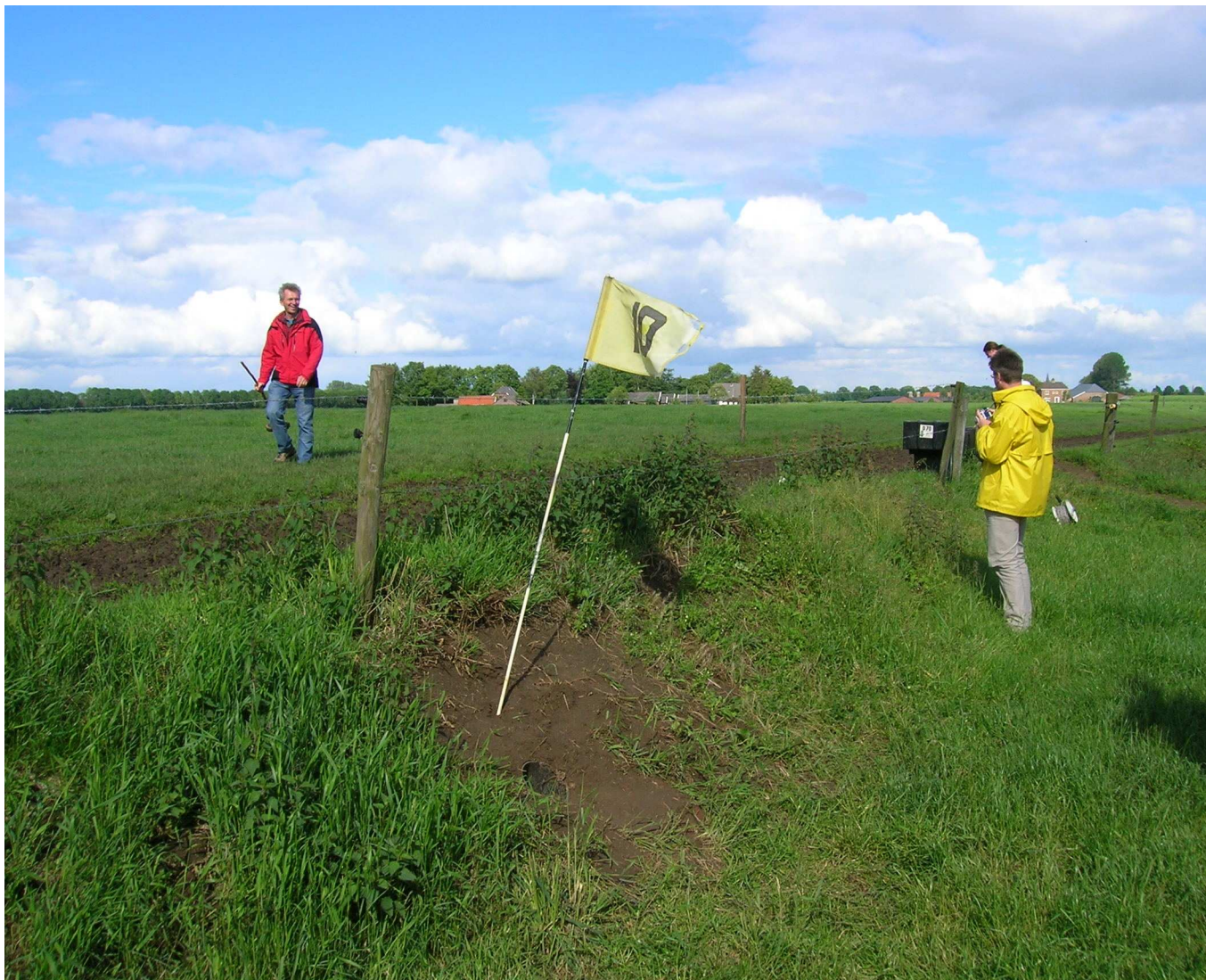
Figuur 2 Laag gelegen beekdal gaat met een steilrand over naar het hoger gelegen oud bouwland