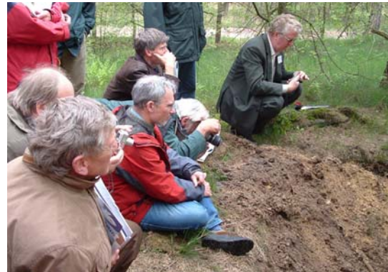
en wij luisteren...

Dan gaan we op weg naar de directe omgeving van de vroegere maar ook huidige zinkfabriek in Budel-Dorpplein. De spoorbaan naar de fabriek ligt op zinkassen. Tien kilometer aan weg is hier met verschillende technieken geïsoleerd of geïmmobiliseerd. Maar ook binnen de poorten van het bedrijf is in de voorbije jaren meer dan een miljoen kubieke meter verontreinigd materiaal verzameld en opgeslagen in zogenaamde jarosiebekkens. Onderweg naar de proefveldjes van Alterra rijden we verder langs het bedrijventerrein, waar zich aan de overkant van de weg een gebied uitstrekt dat valt onder de vogel- en habitat richtlijn! Bij aankomst bij de proefveldjes staat de borrel al klaar. En onder het genot van een hapje en drankje krijgen we een toelichting bij de proefveldje over het verlagen van de cadmiumopname door gewassen van René Rietra.